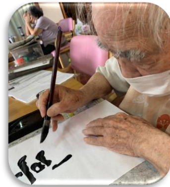
名護さん、立派な筆さばき!

いつも、いろいろなことを教えてくれてありがとうございます。むーとうやーでは、今日も元気な歌声が響いています。