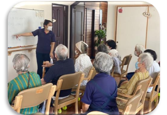
歌詞の意味について意見が飛びかいます。