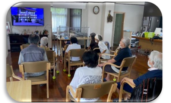
うむいぬ校歌の練習風景。