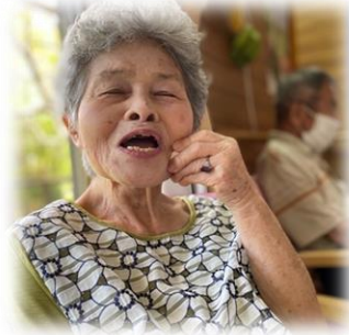
発声練習オッケー!