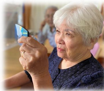
メイクもバッチリ!