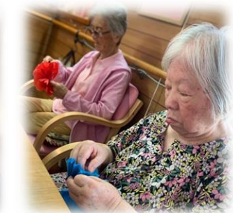
飾りつけも利用者さん。