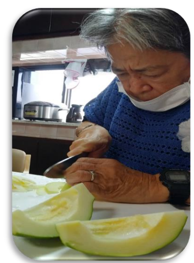
パパヤー調理名人!!