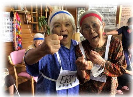
赤も青も運動会おわったら友達！

競技が始まると、どうしても勝ちたくて、本気になってしまいますよね…。ある利用者さんが玉入れ競技のときに、「ありっ！投げて外れた玉拾って、また投げてよ！」と、相手チームの行動を見逃しませんでした。みなさん審査が厳しいですけど、勝負だったらそうなりますよね(笑)。