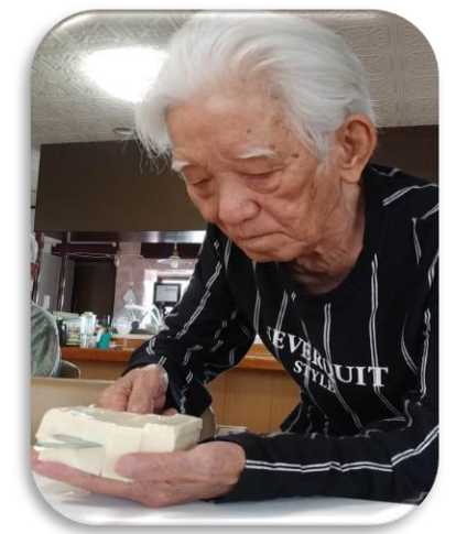
華麗な包丁さばき。