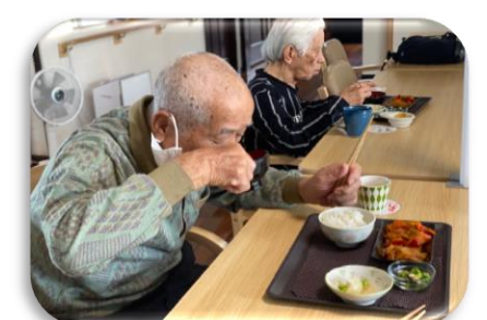
いそがなくても、おかわりありますよ！