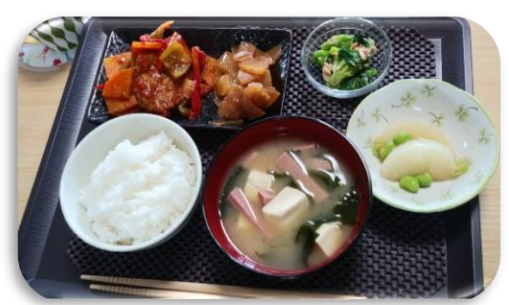
まるで、定食屋さん!!