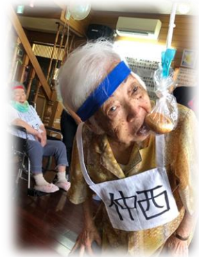
本文と写真は関係ありません。

いろいろ起きましたが勝負はつきました。「青組の勝ち！」自分が赤色のハチマキを巻いていることも忘れ、大喜びする方もいらっしゃいましたが(笑)むーとうやー運動会は無事に幕をとじました。利用者みなさん笑い感動をありがとうございました！！